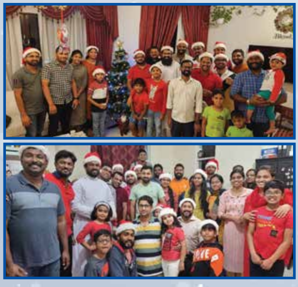
Christmas Carol Round